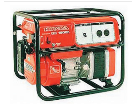
■発電機 2,000w 通常価格 21,600円 15,120円