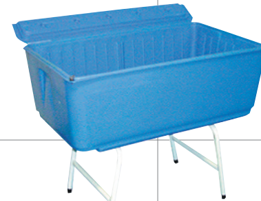
■アイスボックス 150リットル 通常価格 6,480円 5,400円