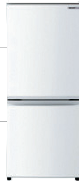
■冷蔵庫 80~100リットル 通常価格 6,480円 5,400円