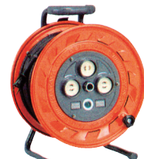
■ドラムコード 4口 通常価格 1,296円 972円

☆発電機2kwを借りられた場合 1台につきドラムコード1コ 648円になります。