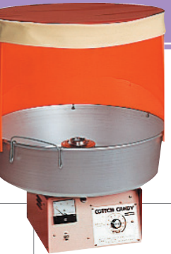
■綿菓子機 W640×D640× H830mm 通常価格 10,800円 9,720円