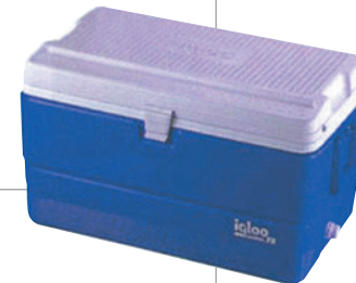
■レジャークーラー 35リットル 通常価格 1,620円 1,377円