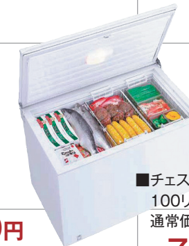
■チェストフリーザー 100リットル 通常価格 8,640円 7,344円