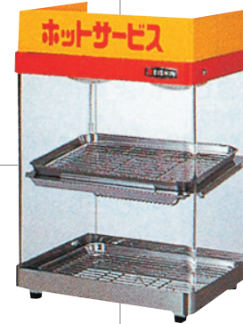
■ホットショーケース W380×D300× H560mm 通常価格 5,400円 4,590円