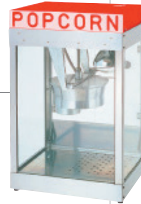
■ポップコーン機 W460×D360×H660mm 通常価格 16,200円 12,960円