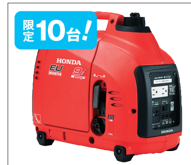
■発電機 550w 通常価格 8,640円 7,560円

生協で発電機をレンタルすると、1台につき1コ、ガソリン専用のタンクを貸し出します。