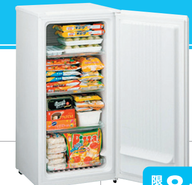
■冷凍庫 100リットル 通常価格 8,640円 7,344円